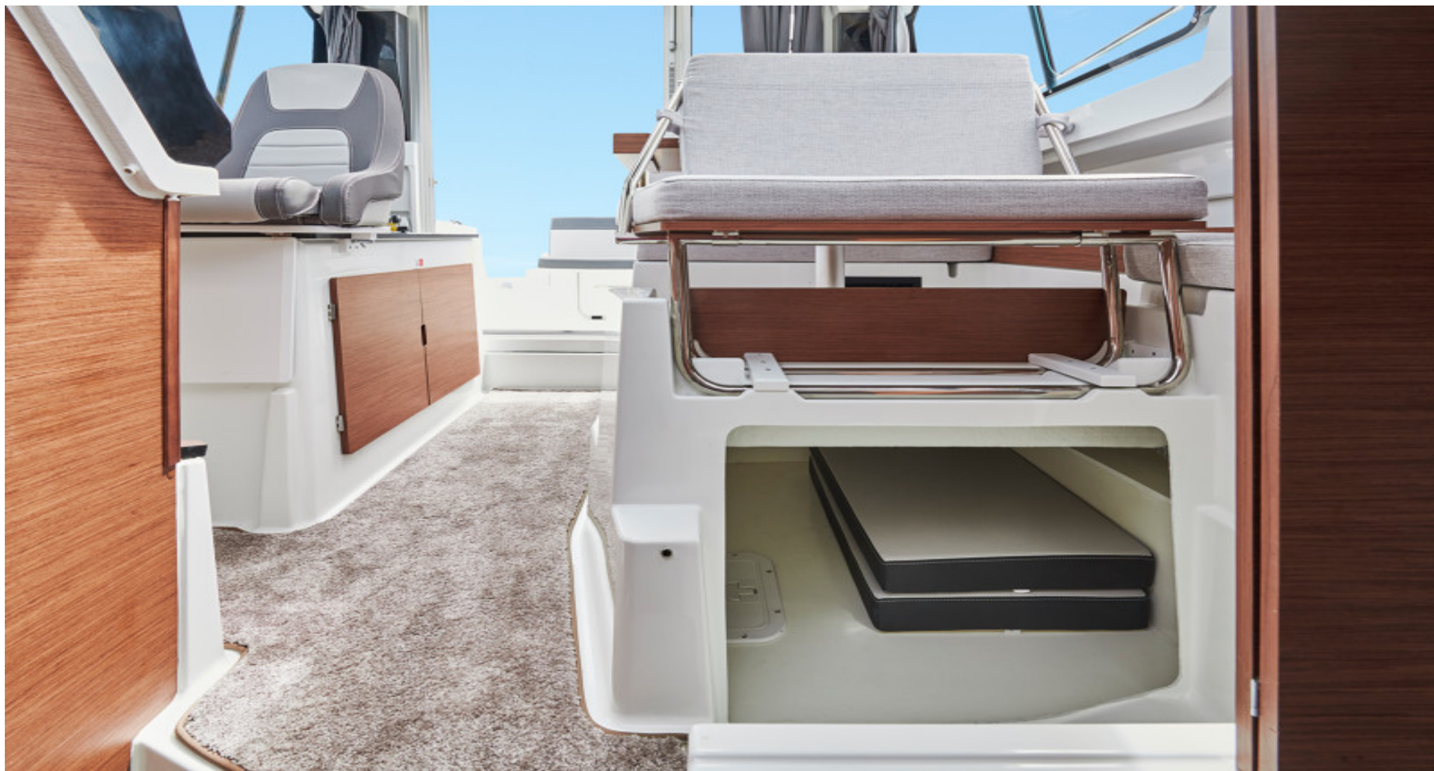
Большой рундук под сидением в салоне