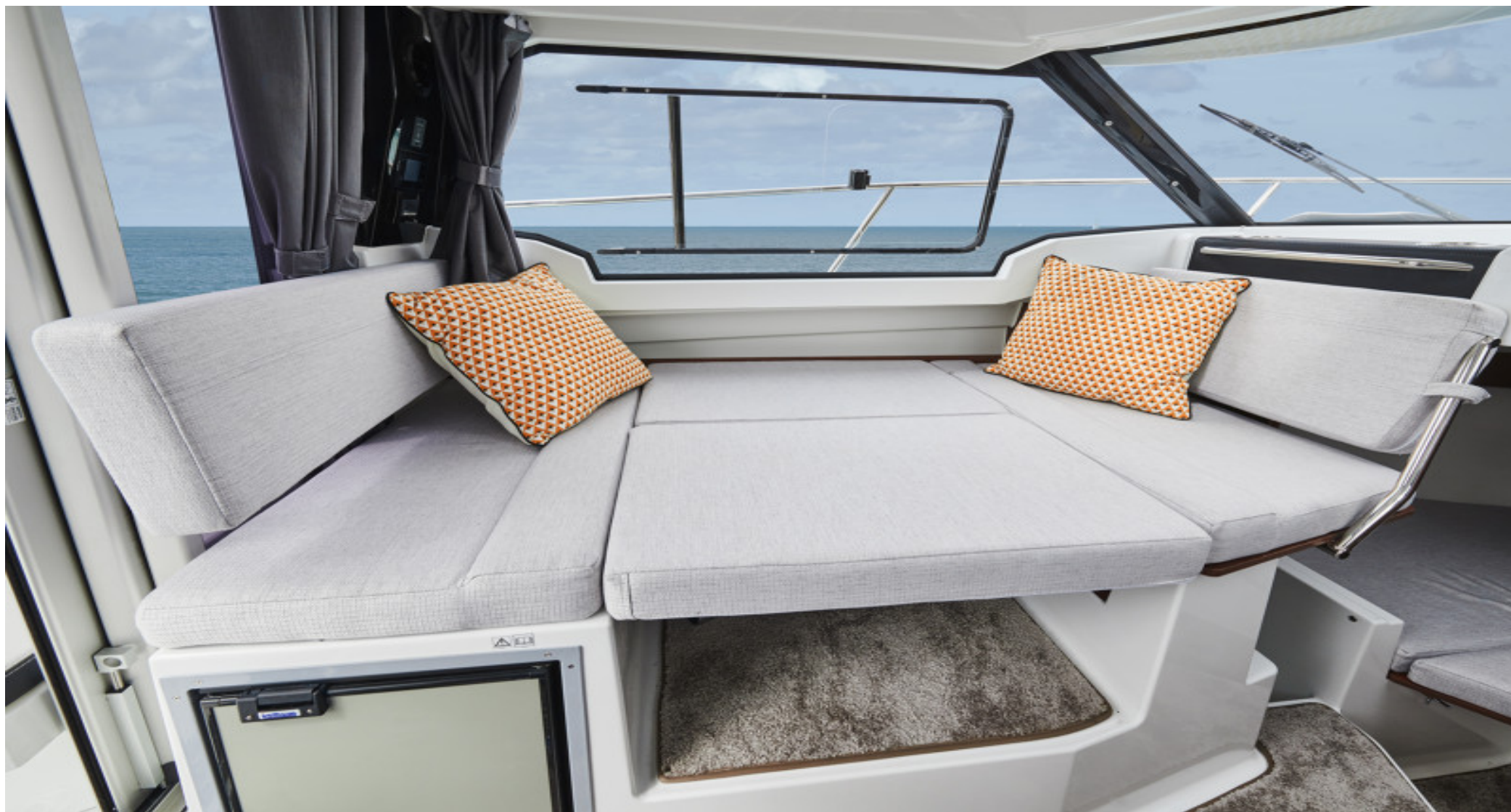
Вставка для организации двуспального места в салоне