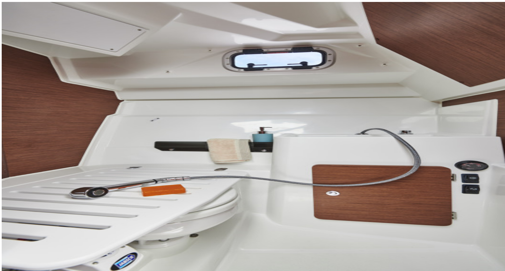
Гальюн с душем