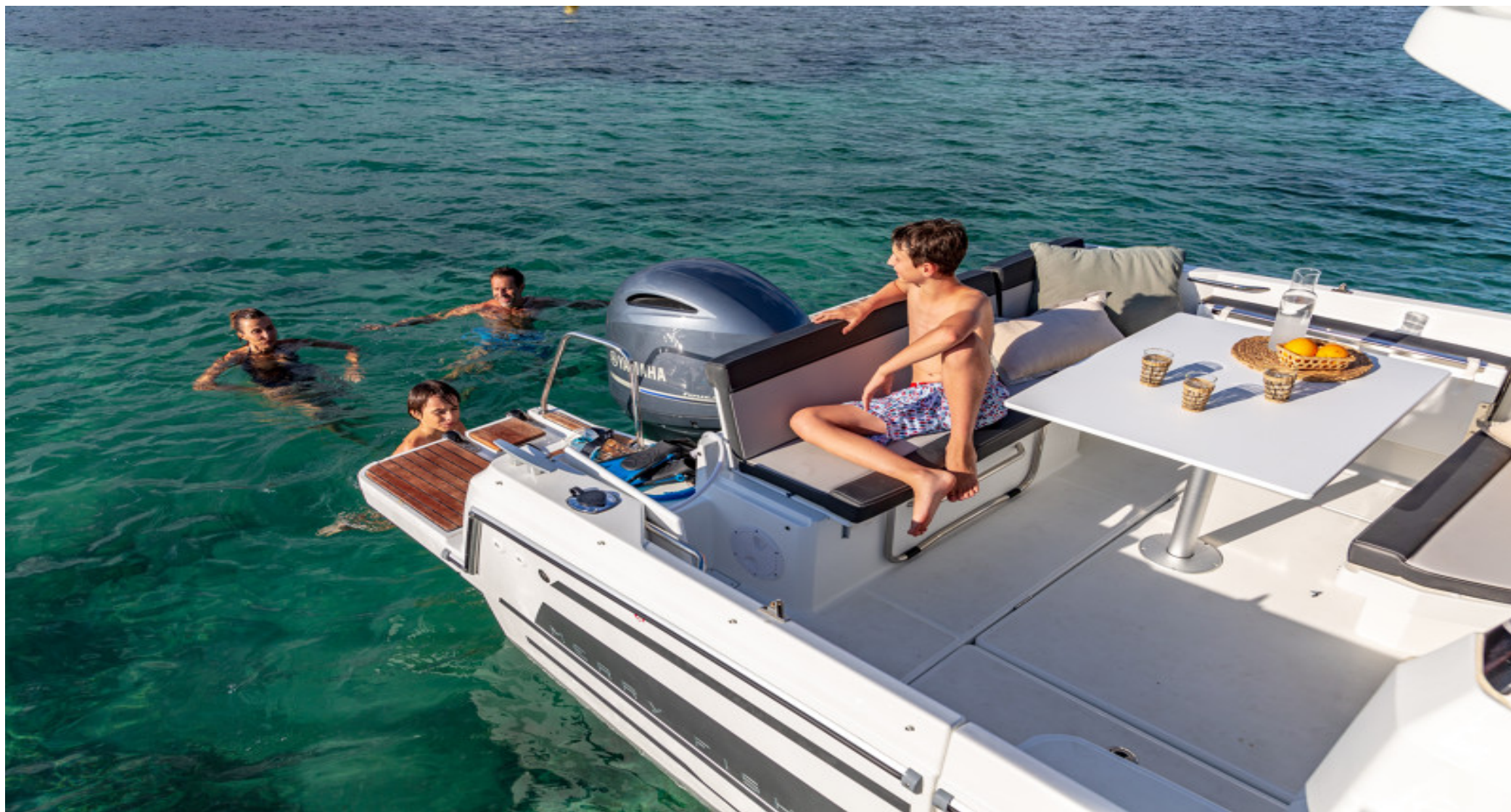
U-образный салон кокпита, трансформируемый в санпад. Откидная скамья по левому борту.