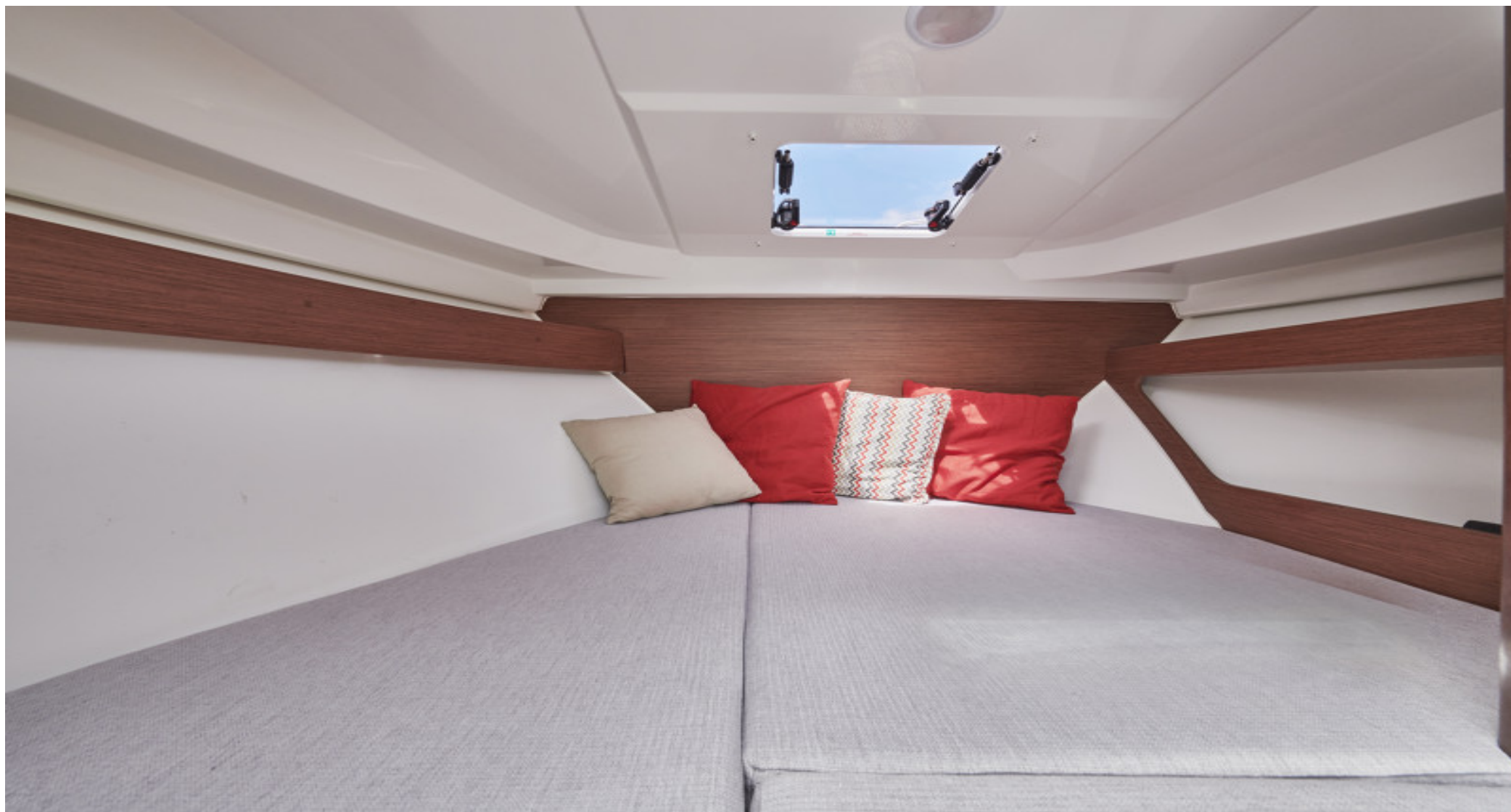
Двухспальное место в кабине