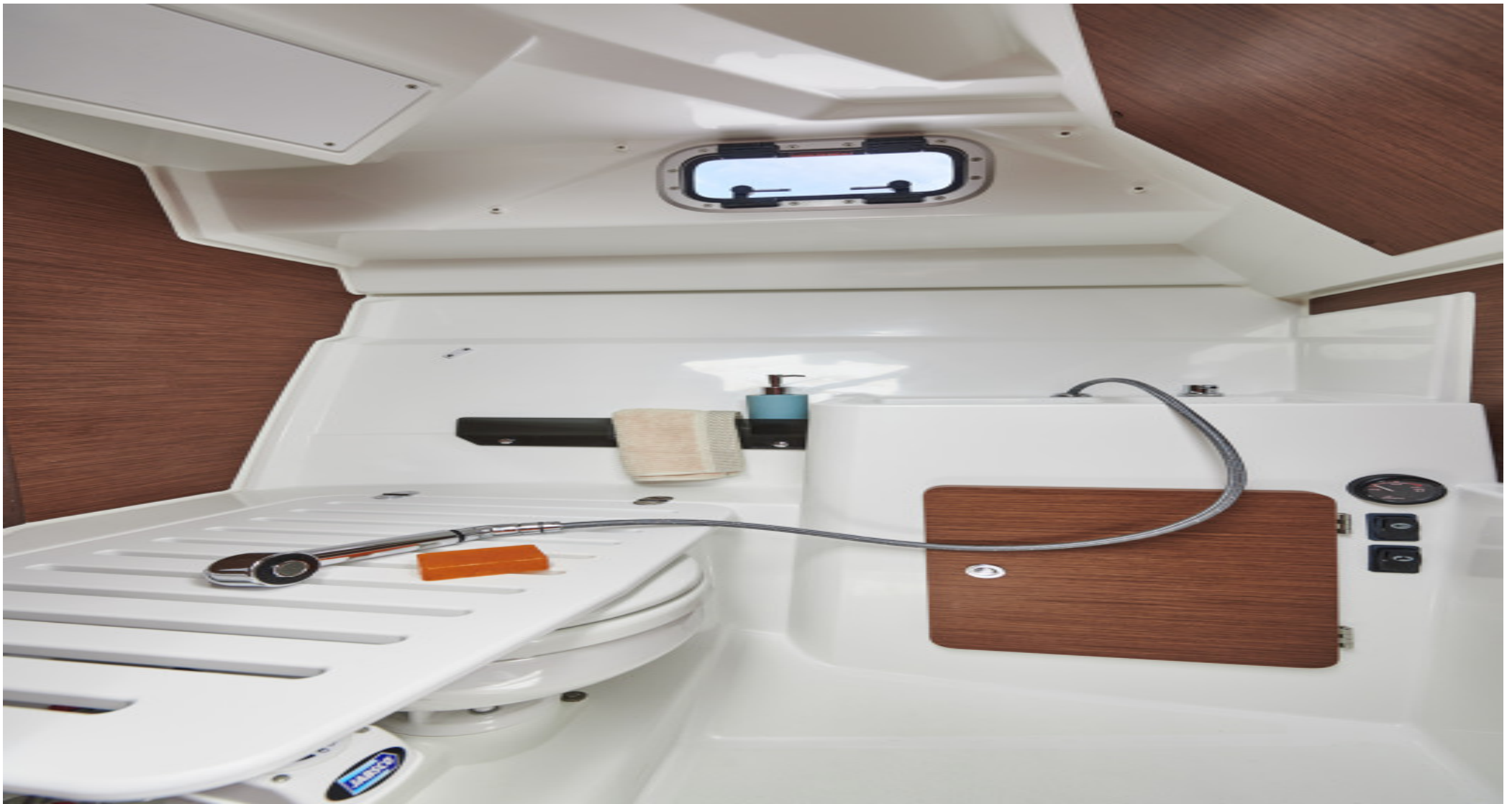
Гальюн с душем