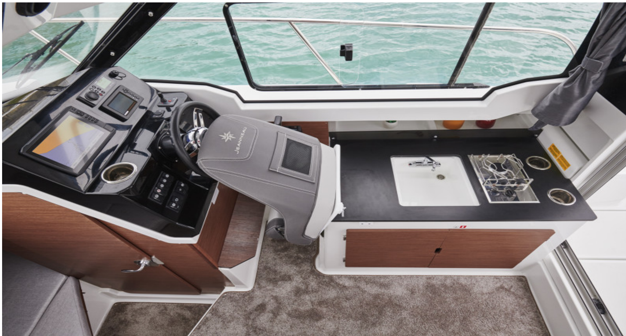
Оборудованный камбуз с газовой плитой, раковиной и холодильником