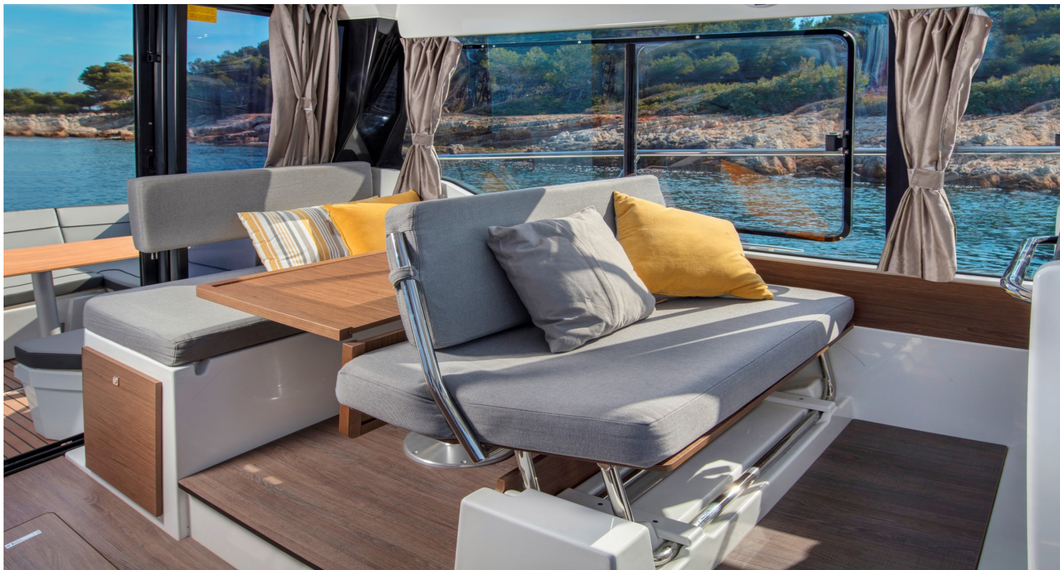
Двухспальное место в салоне