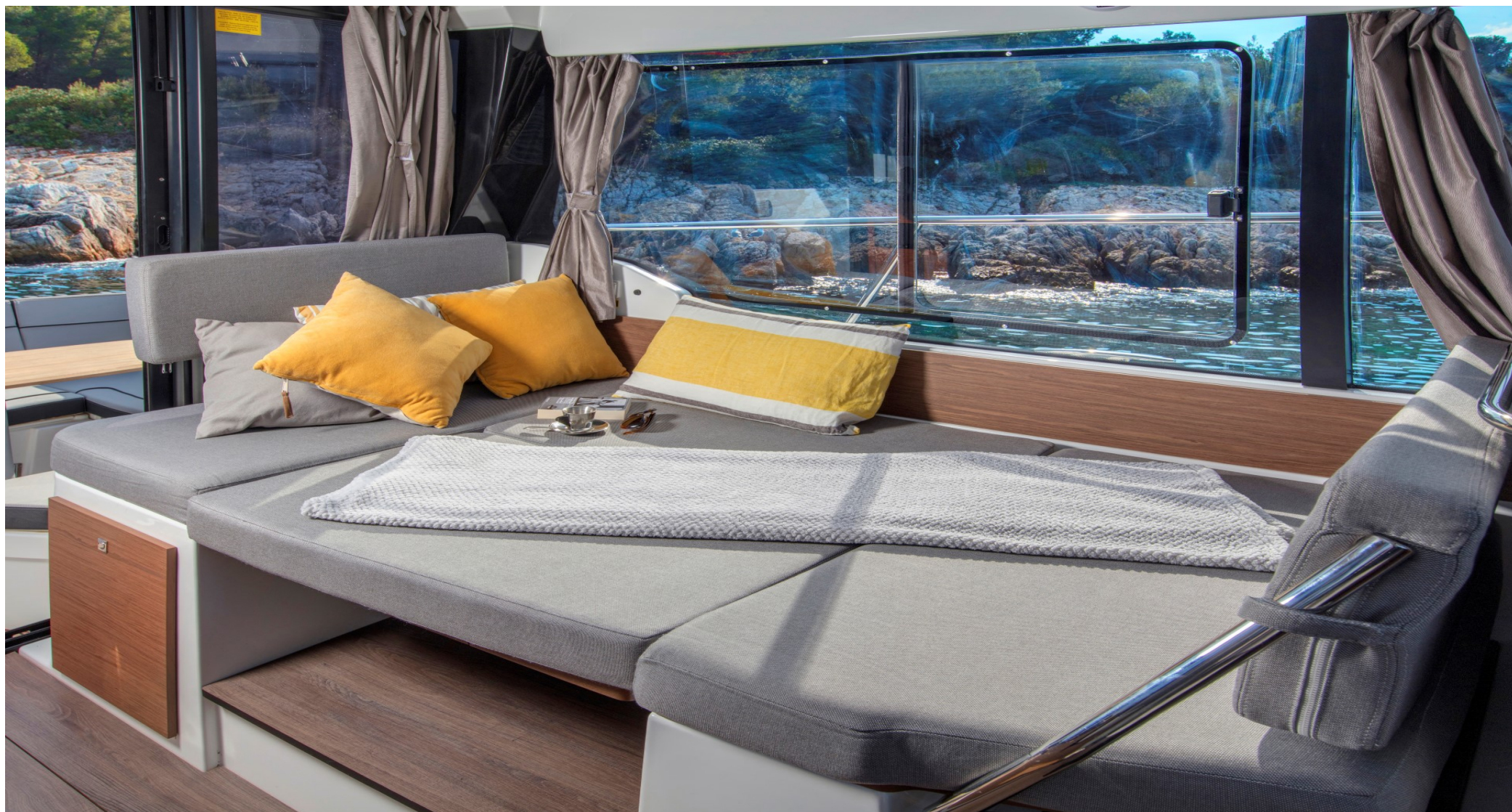
Выход с поста управления на правый борт