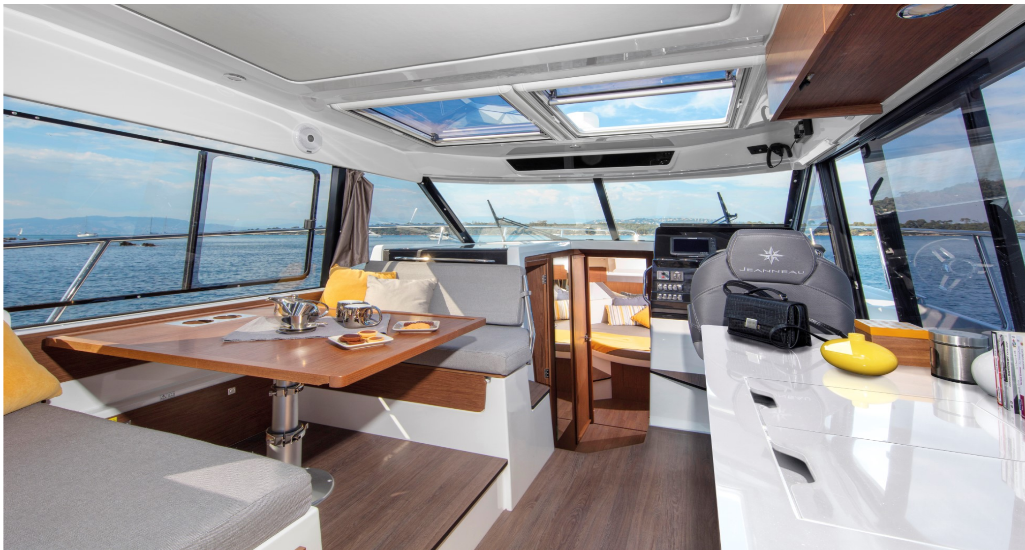
Большой светлый салон