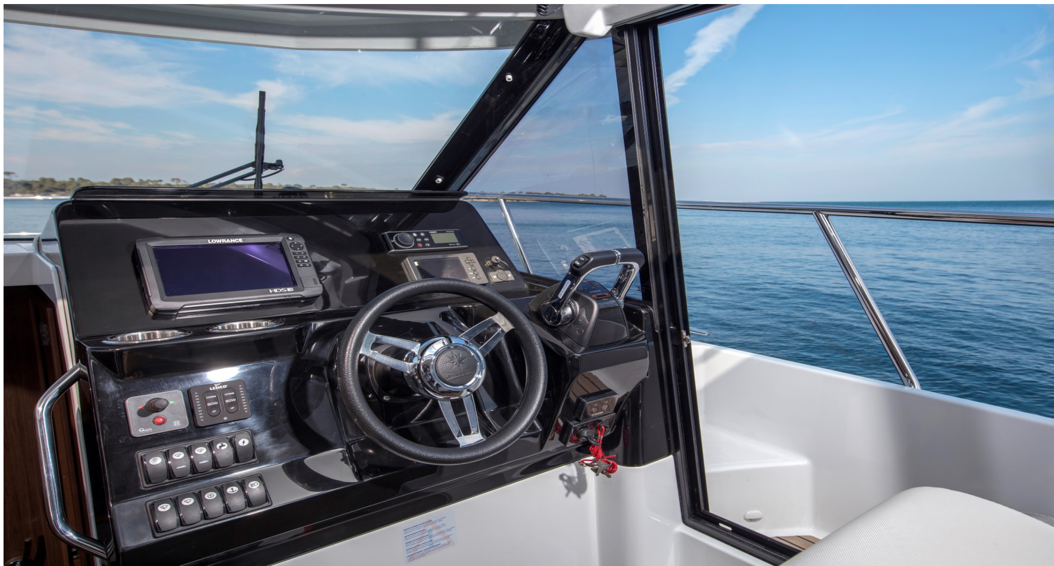
Стеклянная дверь между салоном и кокпитом