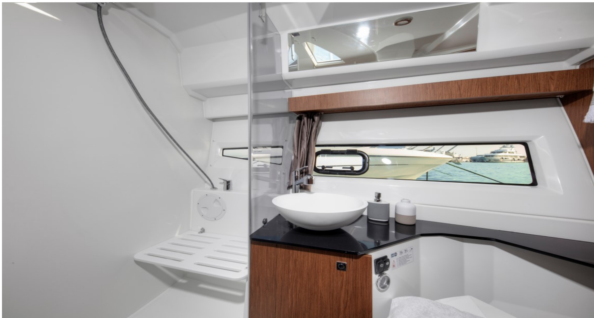
Вторая каюта по левому борту