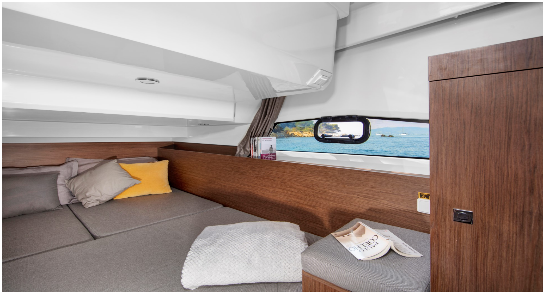
Мастер-каюта в носовой части катера