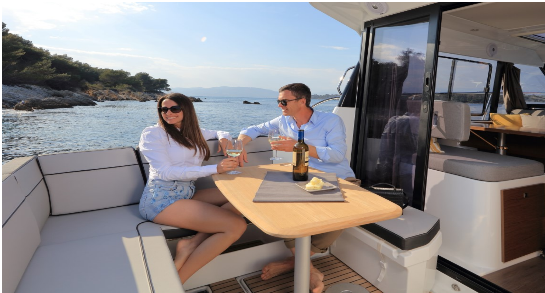
U-образный диван кокпита с тиковым столом