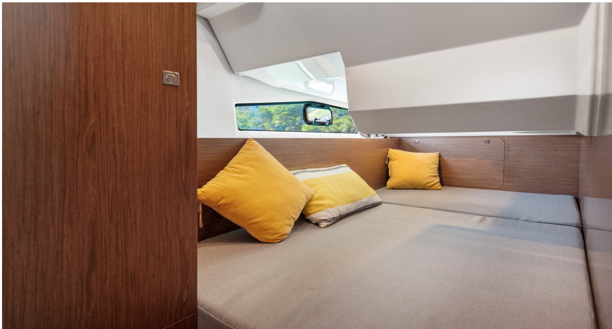
Санузел с отдельной душевой кабиной