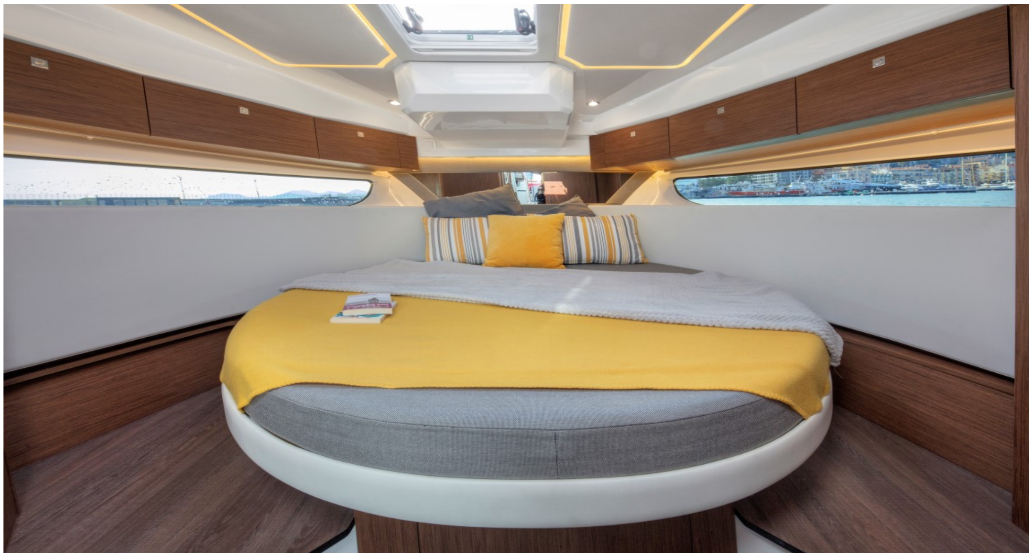
Перекидная спинка дивана