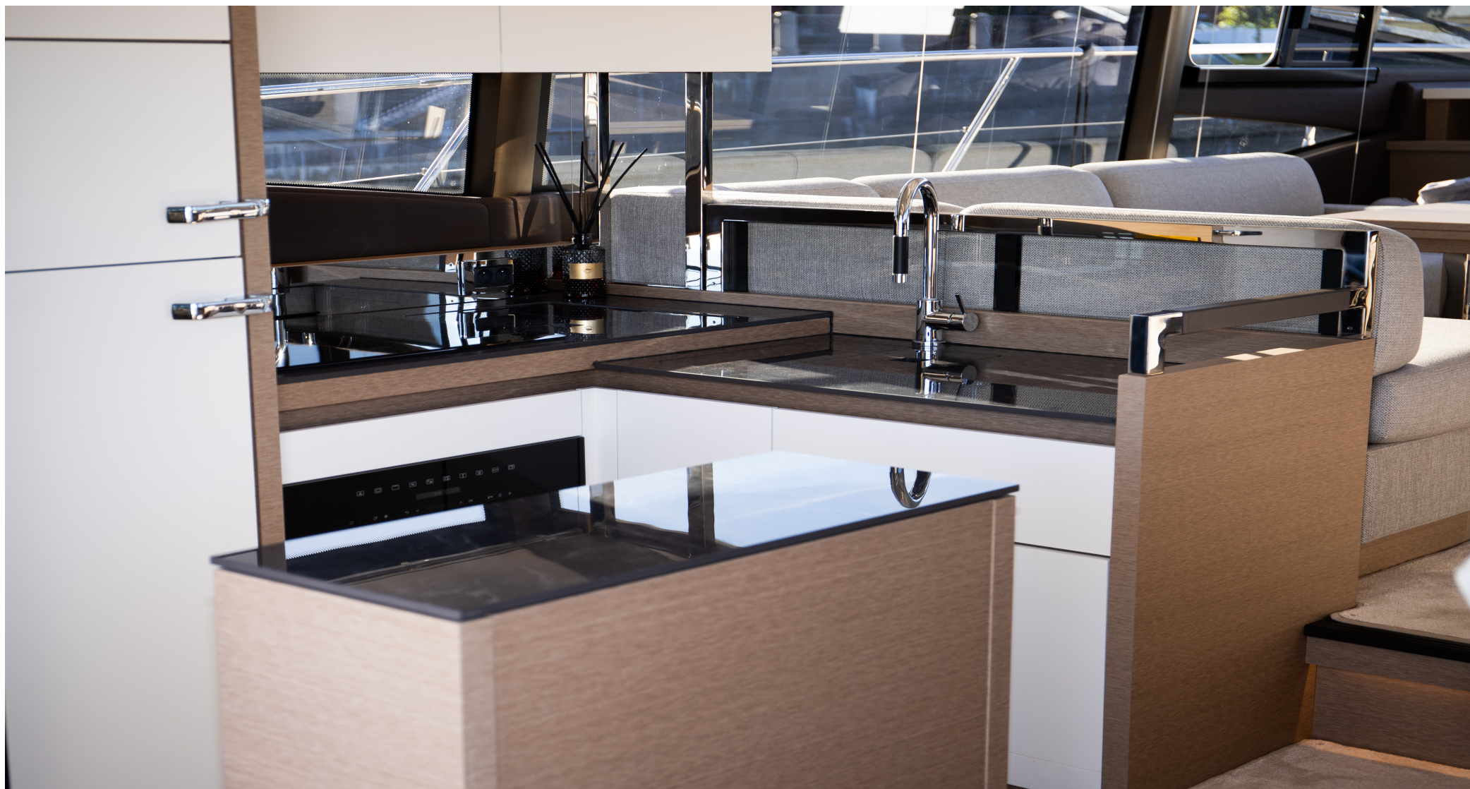
Полностью оборудованная кухня