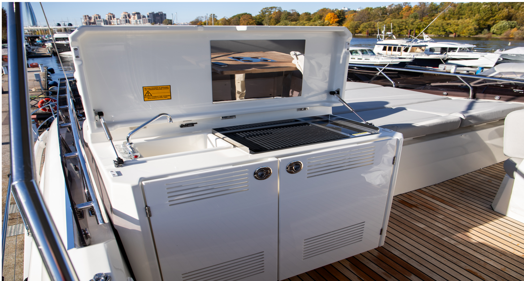
Гриль, холодильник, раковина на флайбридже