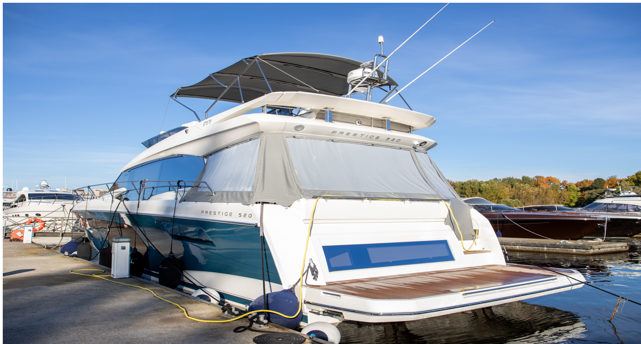
Гидравлическая платформа для купания