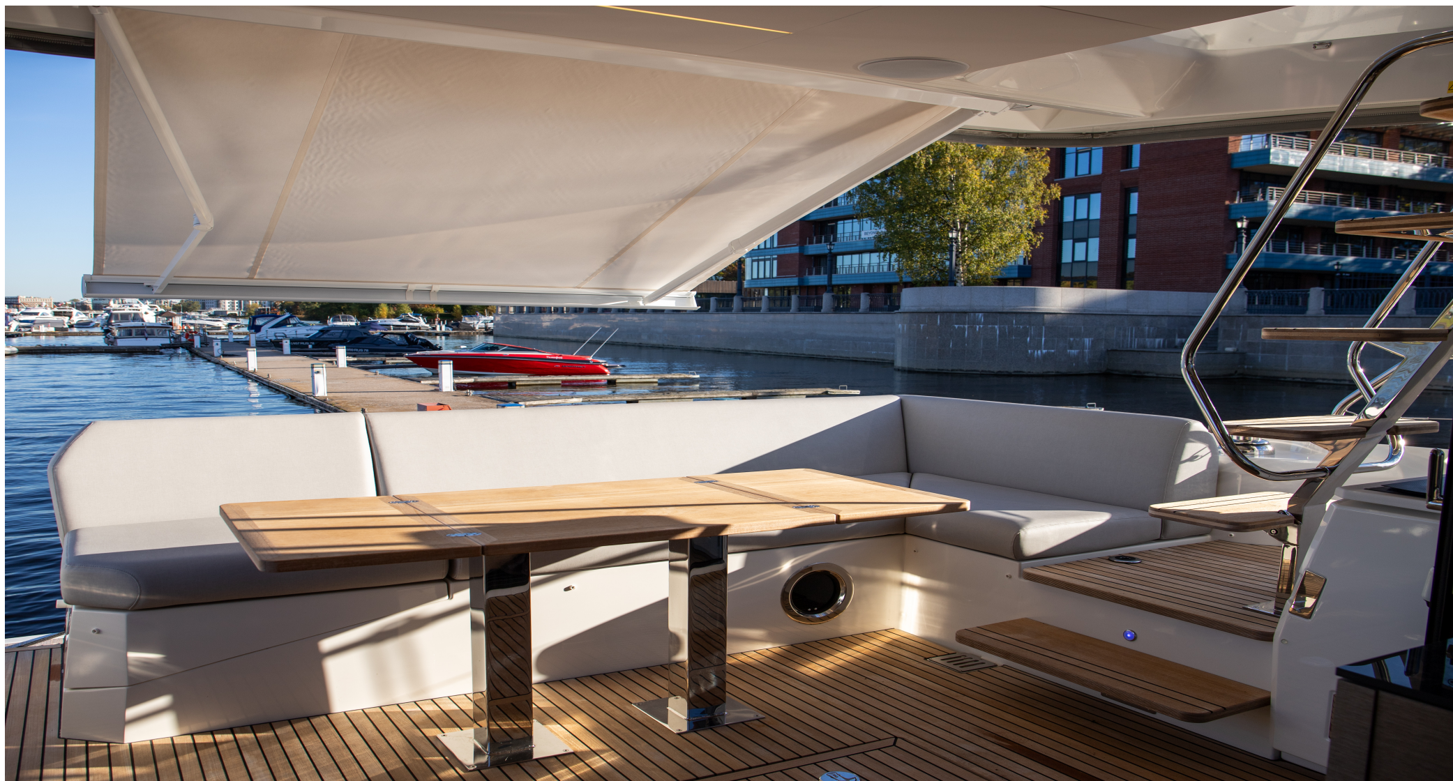
Маркиза на кокпите