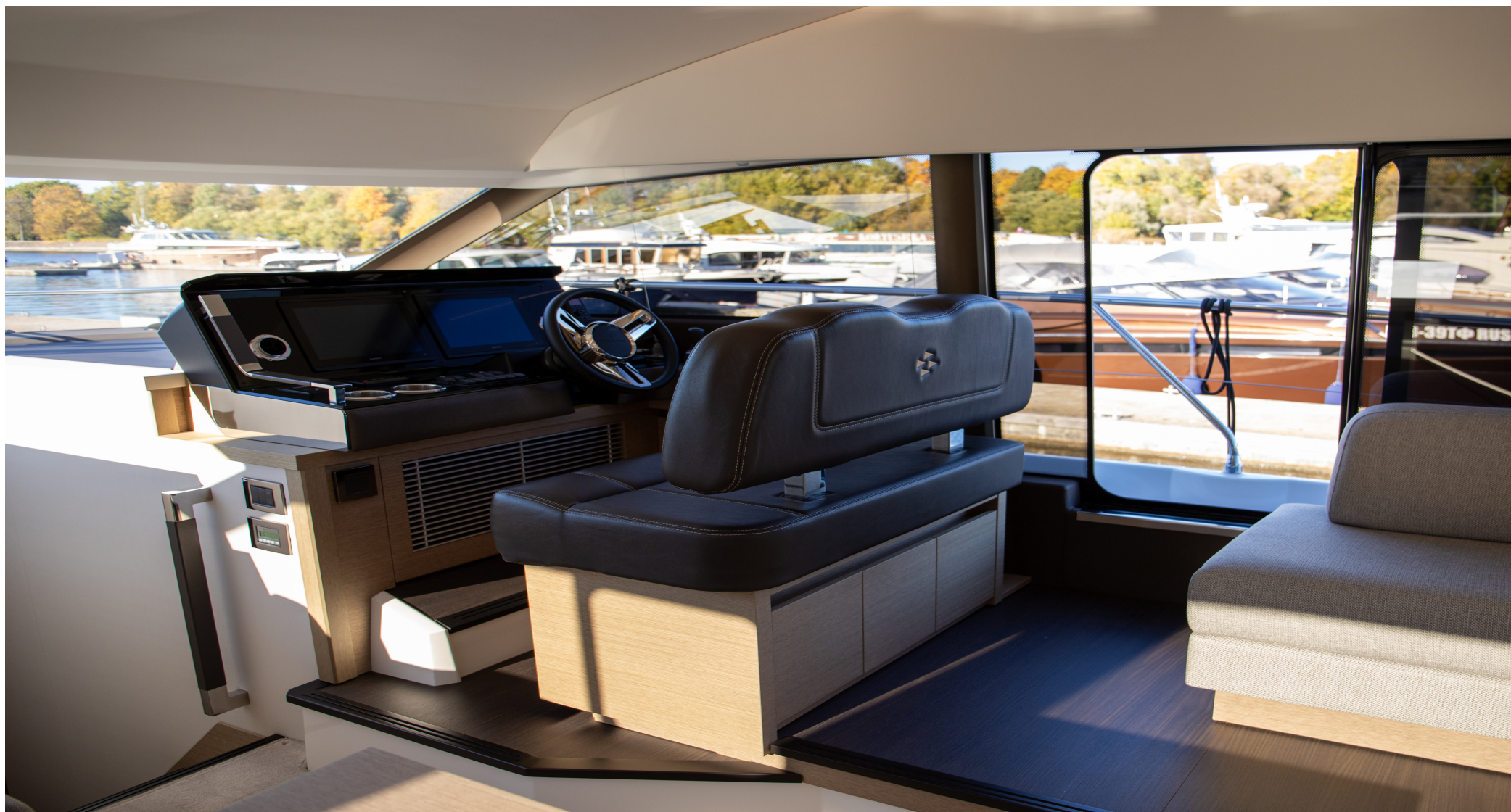
Выход из салона на правый борт