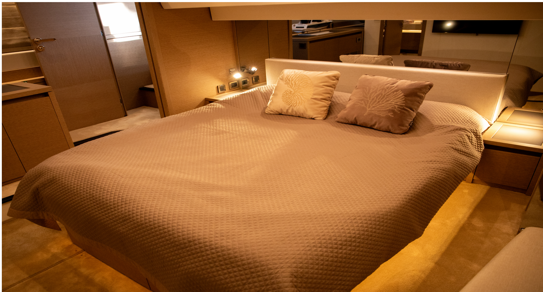
Отдельный вход в мастер каюту