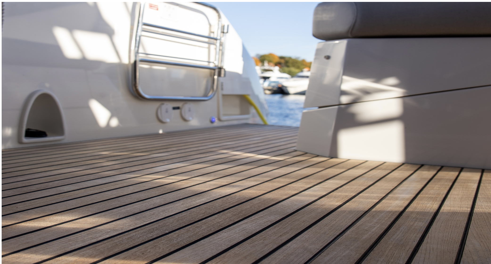
Тиковое напольное покрытие