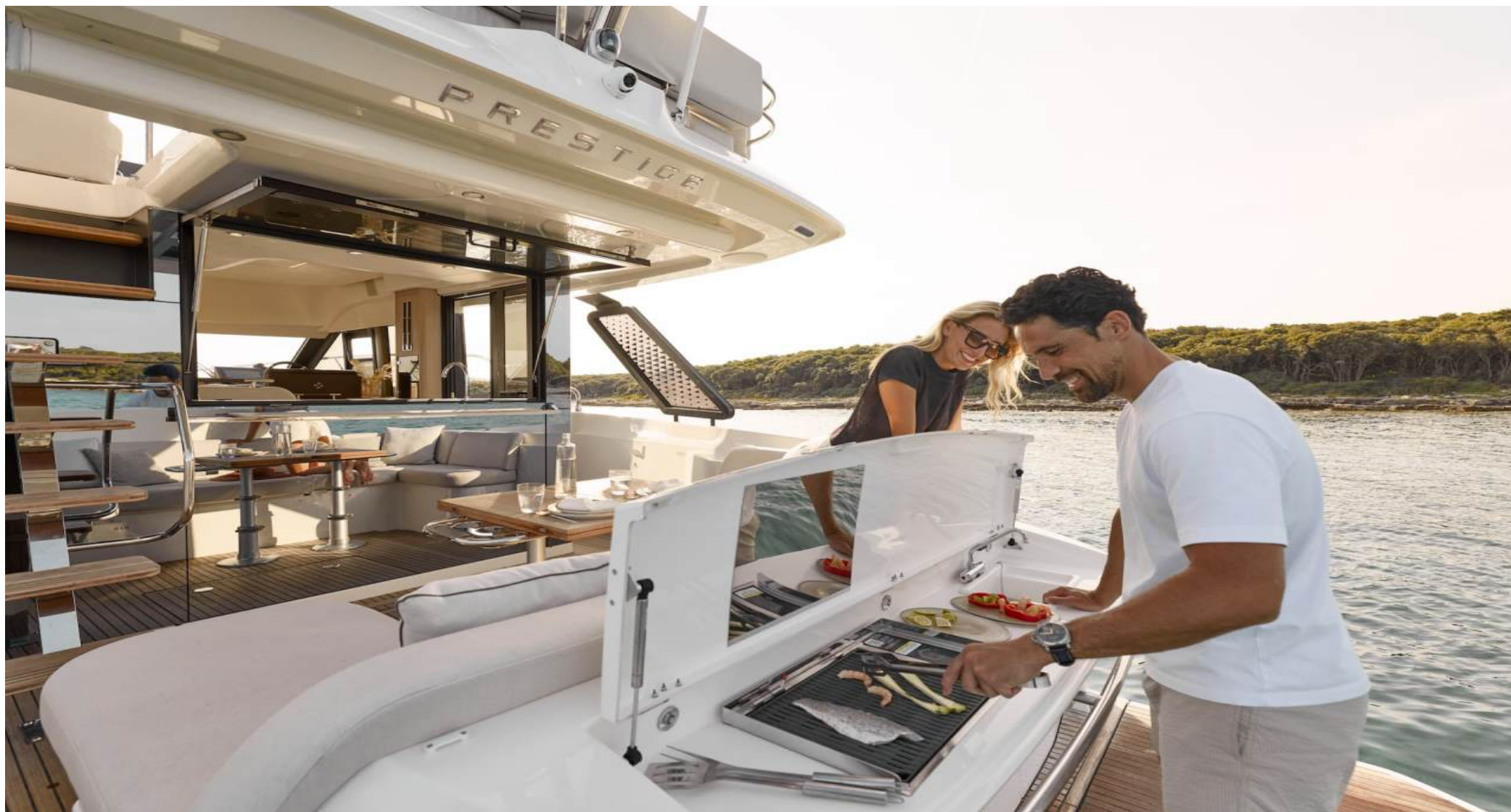
Beach Club на гидравлической платформе