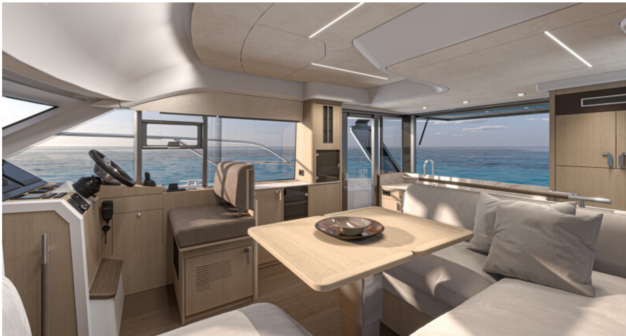
Объемный светлый салон с дизайнерской отделкой