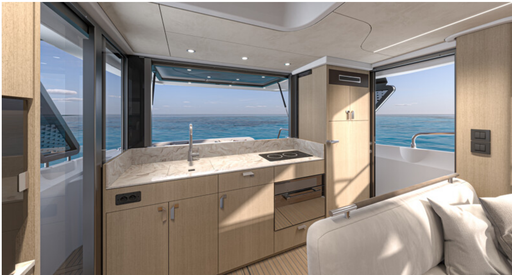
Кухонная зона с видом на воду