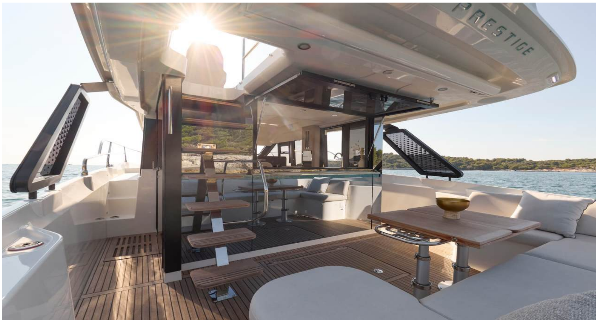
Просторный кокпит с большим обеденным раскладным столом