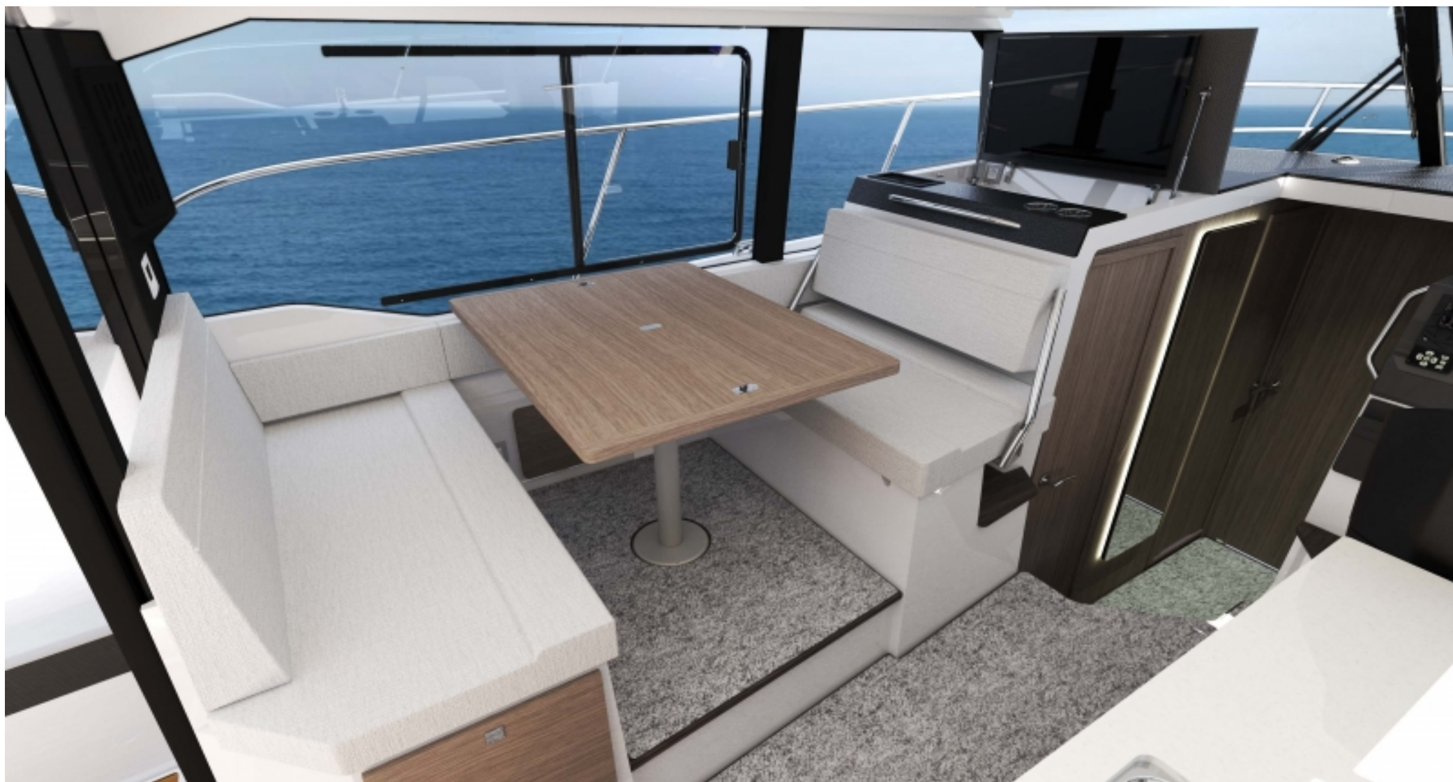
Складной обеденный стол