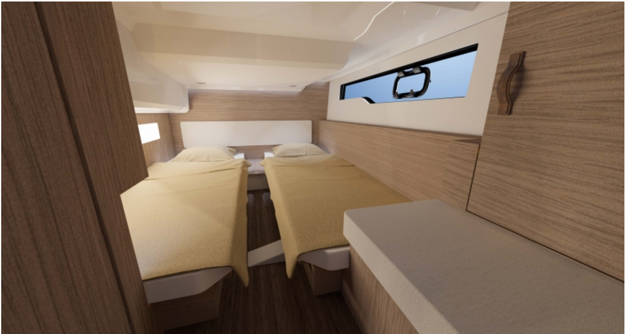
2 полноценные кровати во второй каюте