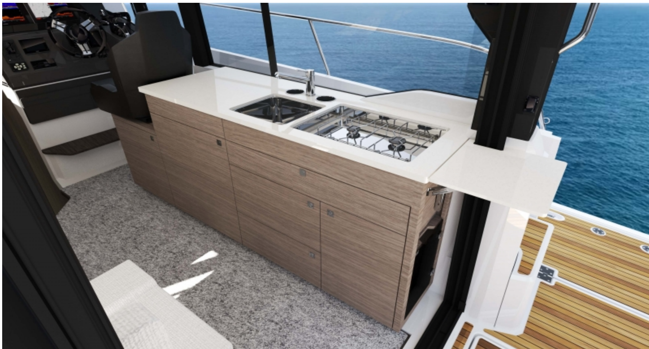
Откидной барный столик на столешнице салона