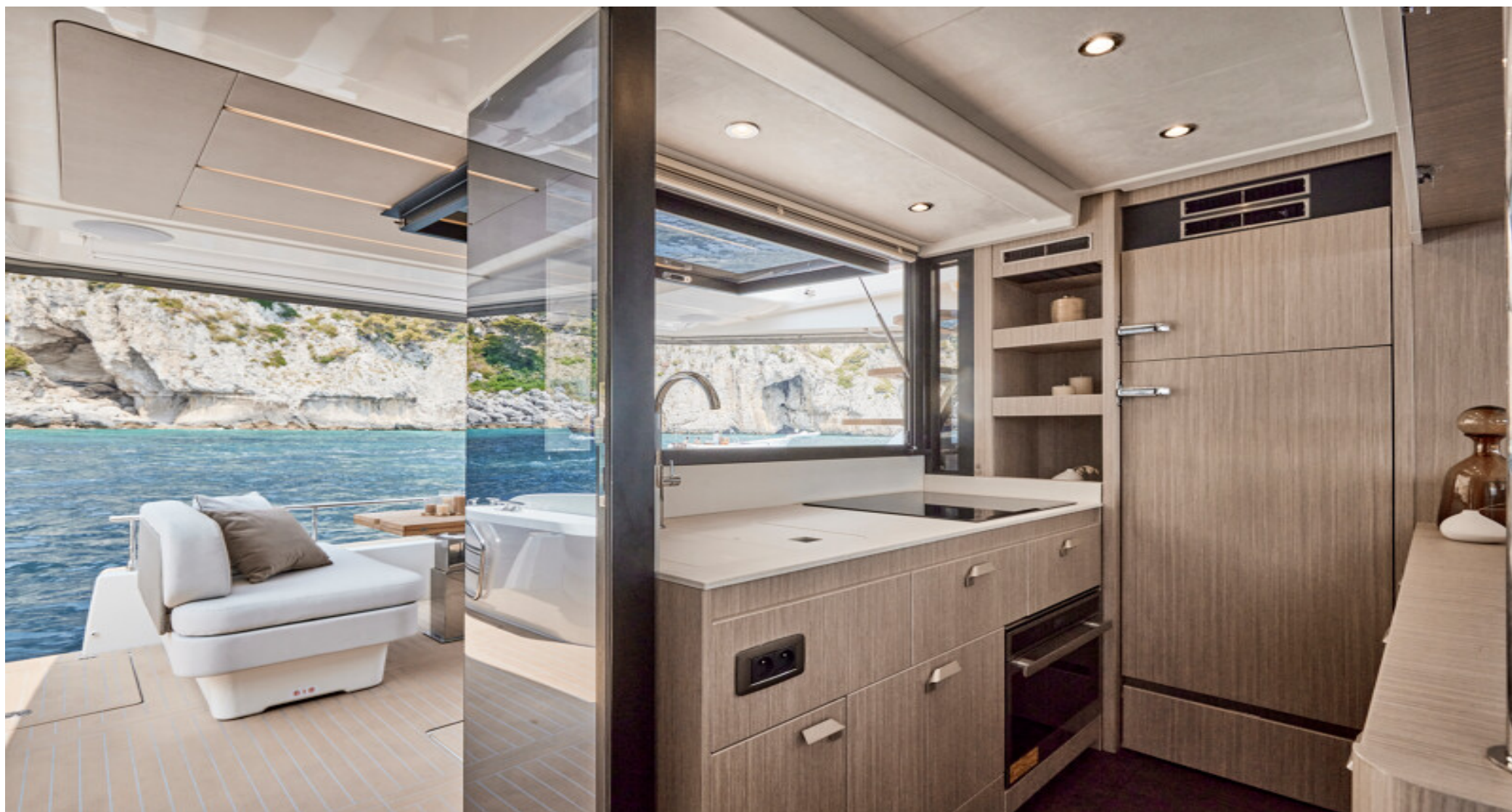
Кухонная зона с видом на воду