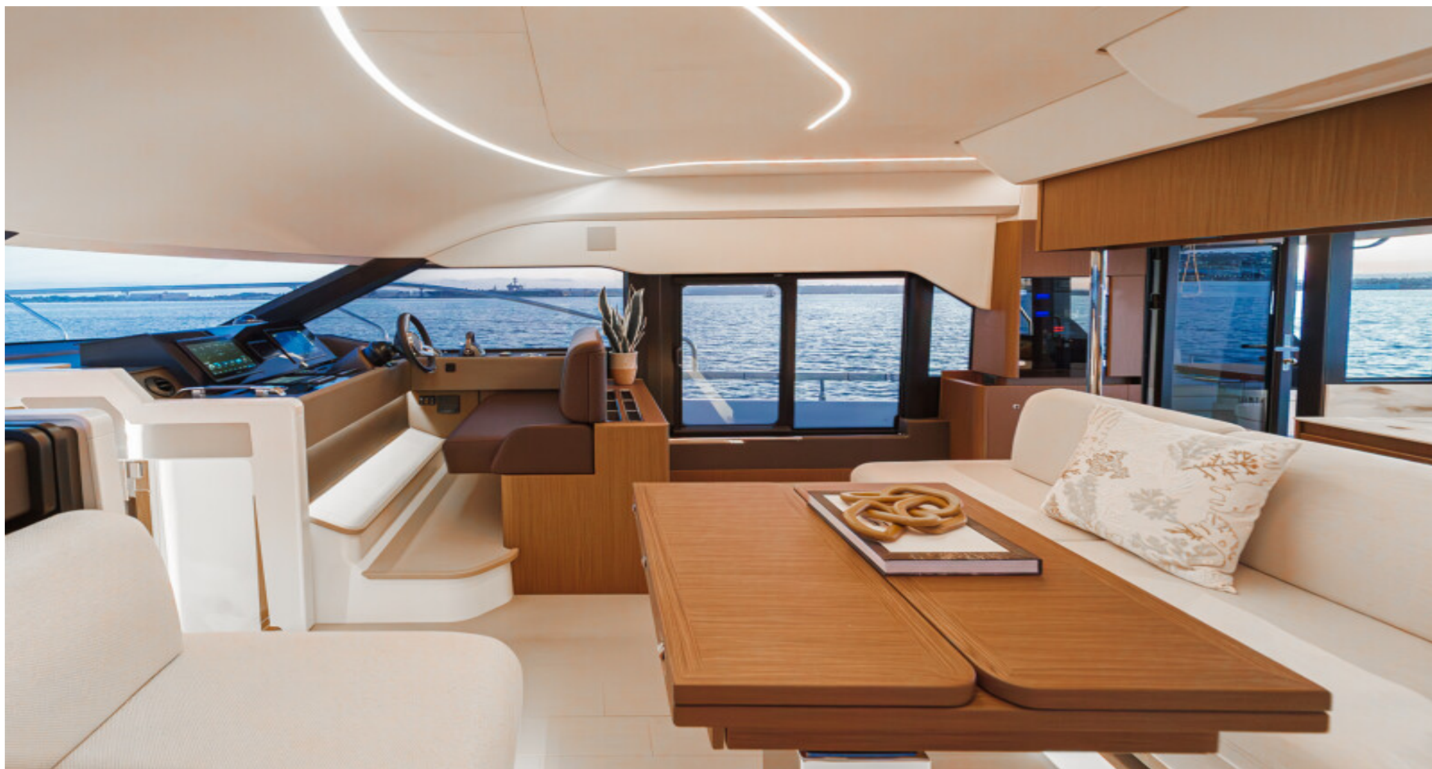
Объемный светлый салон с дизайнерской отделкой